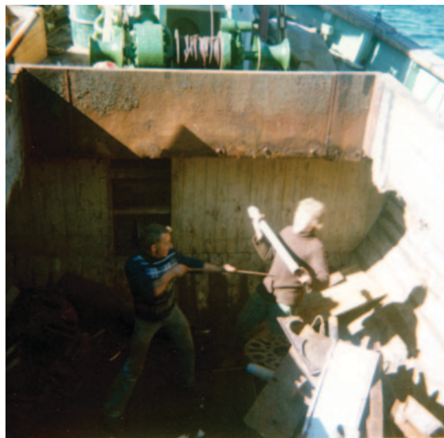
Over: Skøyte med lasterom og plass til jernskrap på 1970-tallet.