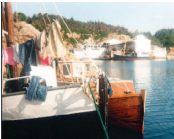
Over: Ankringsplass i Øklandsvågen, vest på Bømlo i Hordaland.