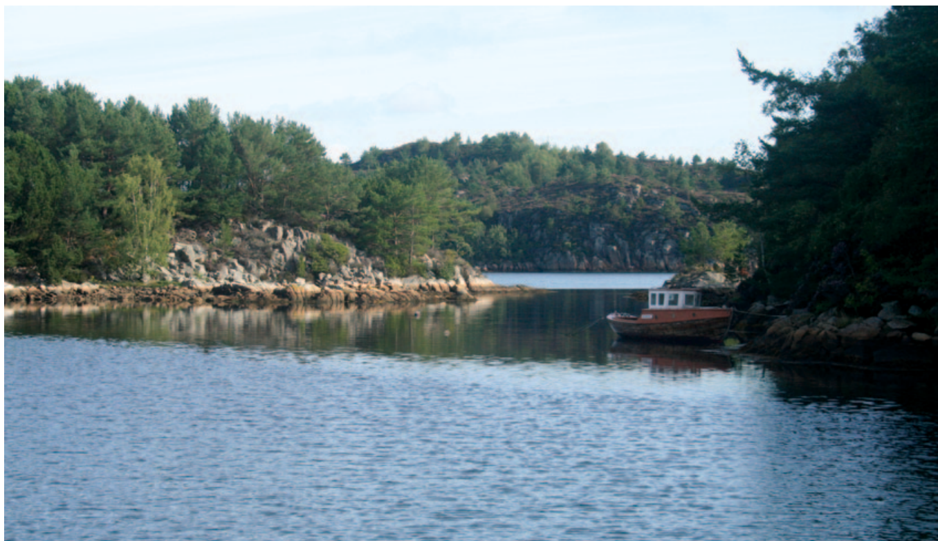
Røysundkanalen på Bømlo. Mange reisende overvintret i båt her helt fram til 1960-tallet.