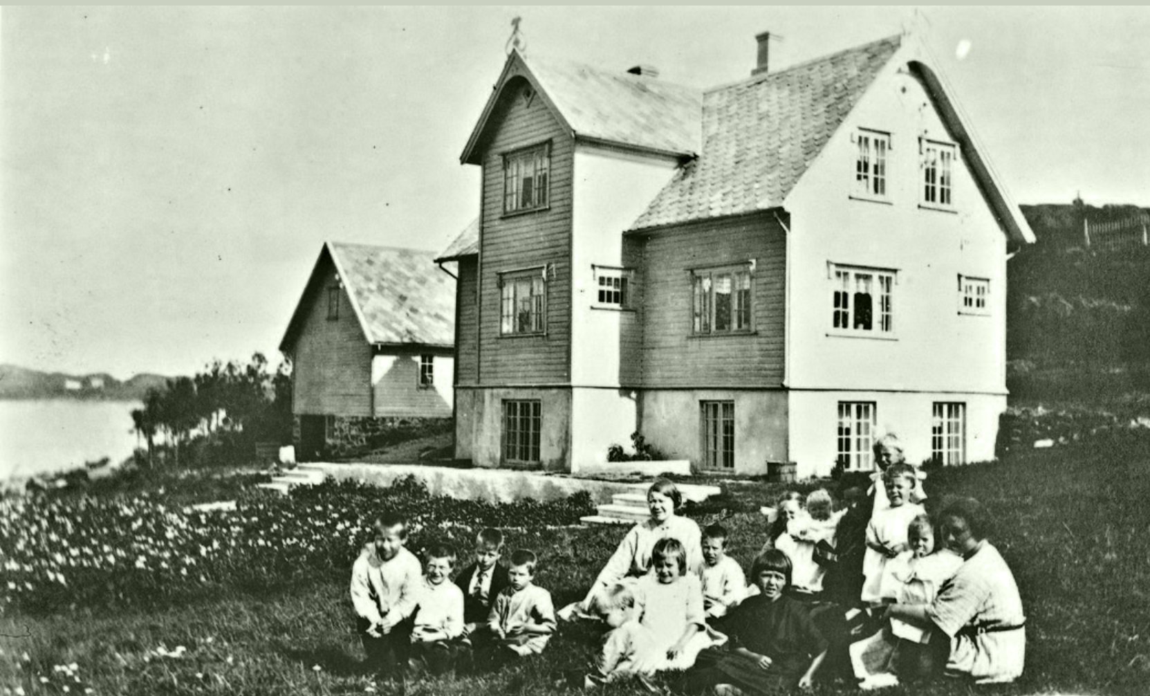
Barn utenfor Jacob Walnums barnehjem, Kopervik på Karmøy, 1922.