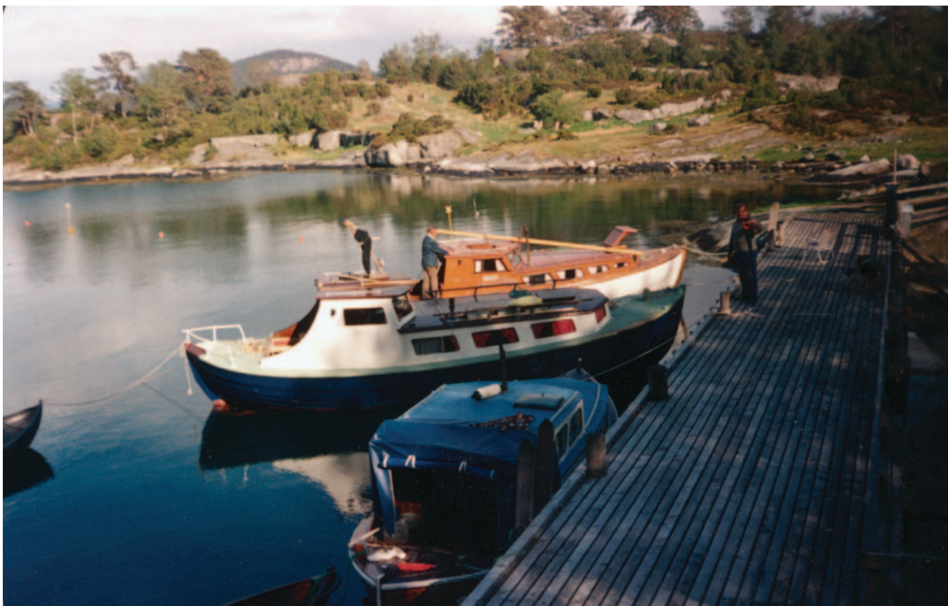
Flere båter har ankret opp på Føyno i Sunnhordland, 1990-tallet. Mange fortsatte å ta små turer med båt etter de ble bofaste.