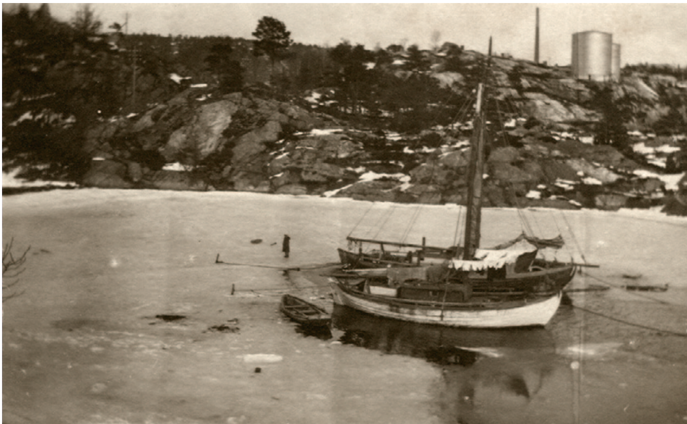
Båtreisende frosset inne i Hannevika ved Kristiansand.

båter helt siden 800-tallet. På nordsiden seilte de ut Ålfjorden og videre nordover til Sunnhordland. En mann født i 1866, fortalte at "Då eg var liten, såg eg splint som drog her òg. Ungane sprang med lunner og la etter båten etter hvert. Det var tofter i båten, hunendar og slikt dei la under. Dei fylgde vegen her borte når dei drog". Senere var det vanlig å leie en bonde i Skjoldastraumen eller Haraldseidvågen som kjørte båtene over dragseidet med hest og høyslede. Haraldseidet er det siste av de store dragseida langs kysten som har vært i vanlig bruk i gjennomgangsferdsel. De båtreisende var av de aller siste som brukte dette eidet, så sent som på slutten av 1940-tallet.