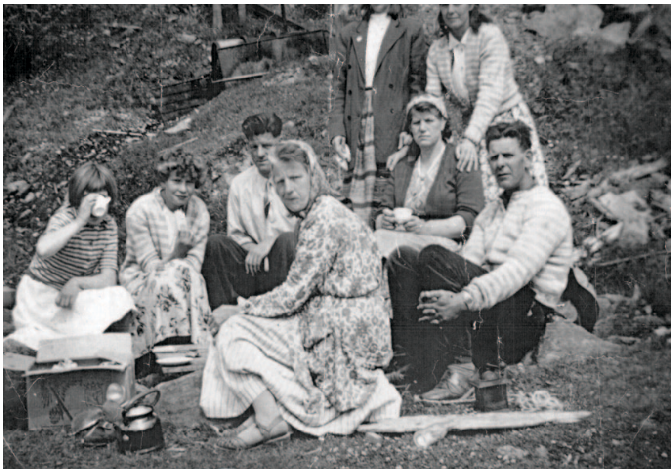
Båtreisende har kaffepause på land, trolig i Os, Hordaland, 1950-tallet. Kjelen og kaffikverna var fast utstyr i båten.

og mannen var da de kunne flytte inn i sin første båt: "Første heimen vår va jo fakta ein båt, og då va vi så overlykklige at de va eit syn, for de va endeleg vårt". Pyntehåndkleet ble hengt opp i byssa og senger og kjørler ble skaffet til veie ved hjelp av venner og kjente. Idealet om å være ei god husmor og mor var selvsagt til stede også blant de reisende kvinnene, og for mange var det ekstra viktig å vise omverdenen at de hadde det ryddig og reint om bord. I bakhodet lå redselen for at Misjonen kunne komme og ta ungene fra dem.