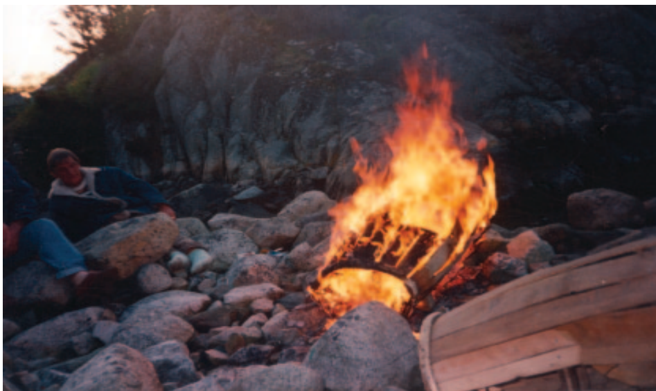
Leirbålet har alltid vært et samlingspunkt for de reisende. Når de reisende samles i dag synges det ennå romanviser og fortelles historier rundt bålet.

I det siste tiåret har det utviklet seg en sterk offentlig interesse for historien og skjebnen til romanifolket i Norge. Dette kommer trolig både av den generelle interessen for minoritetsspørsmål og mer spesielt av den sterke mediefokuseringen omkring rasehygiene, med de ulike tiltakene som over tid er blitt gjennomført i Norge. Særlig har steriliseringsloven av 1934 og konsekvensene den loven hadde for romanifolket, vært i fokus.