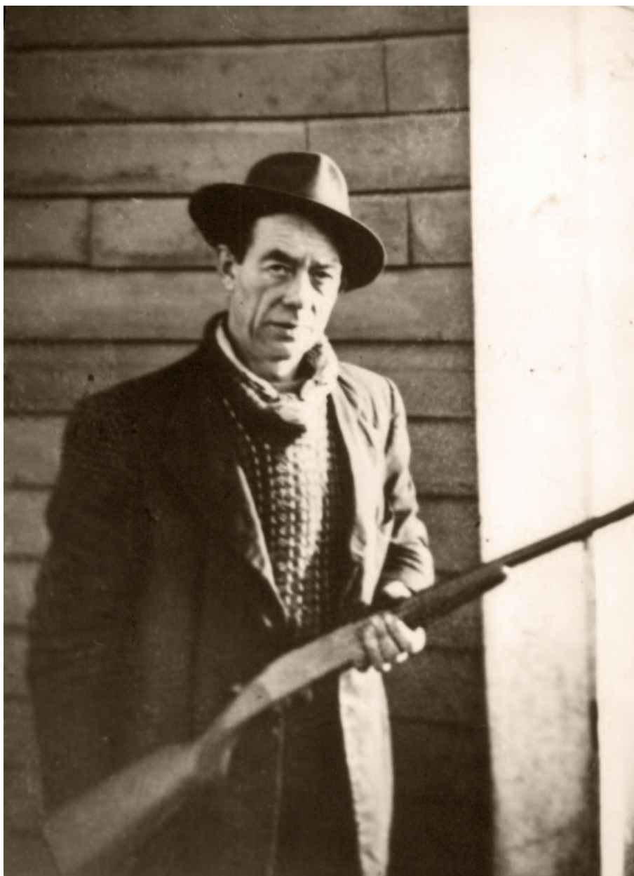
Jakt på sjøfugl var en viktig inntektskilde og matauk.

Å holde sulten borte og skaffe mat til familien var den viktigste oppgaven. Mange fastboende delte mat med de reisende, eller ga dem brød og poteter. En mann født i 1940 forteller at de byttet