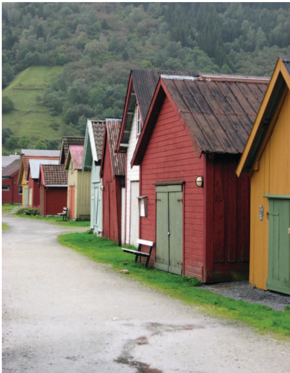
Vik i Sogn, der mange reisende hadde vinterbosted fram til slutten av 1930-tallet.