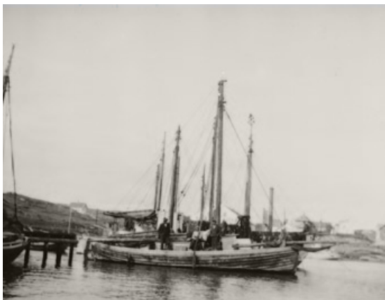
Båtreisende i ei skøyte utenfor Kopervik, omkring 1910.

hadde soveplass og ofte et lasterom som kunne fylles med varer. Det er usikkert når de dekkbygde skøytene ble vanlige å bruke blant de reisende, men langs hele kysten, fra Østfold til Troms, kunne en i tiårene før og etter 1900 møte helårs båtreisende. Vinterstid kunne det også ligge "taterbåter" langs Akerselva i Oslo. Et kjerneområde var kyststrekningen fra Sørlandet til Nordvestlandet. Midt på ligger Sognefjorden, som strekker seg fra de ytterste nakne øyene ute i Solund til Øvre Årdal og Skjolden, som ligger 204 km inne i