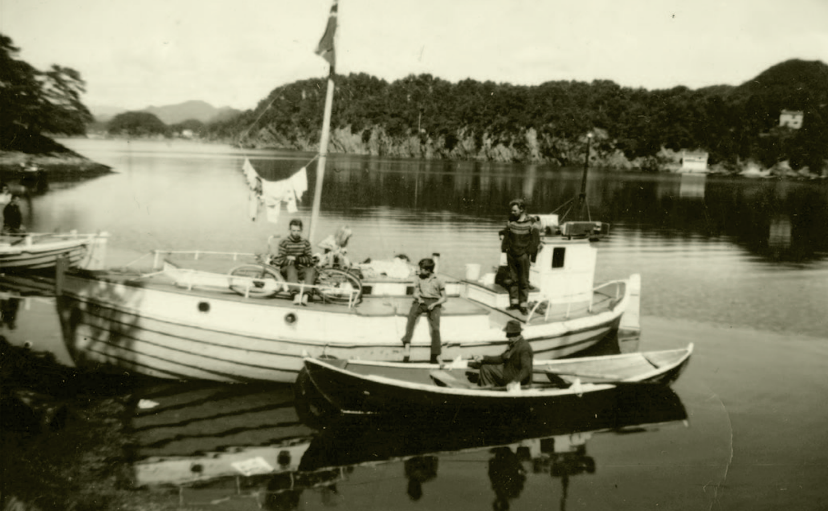
Tre generasjoner båtreisende har ankret opp i Os i Hordaland på 1950-tallet.

deres arbeid. For å overleve som et folk og en kultur kjempet romanifolket en tøff kamp mot Misjonen og norske myndigheter i nesten hundre år.