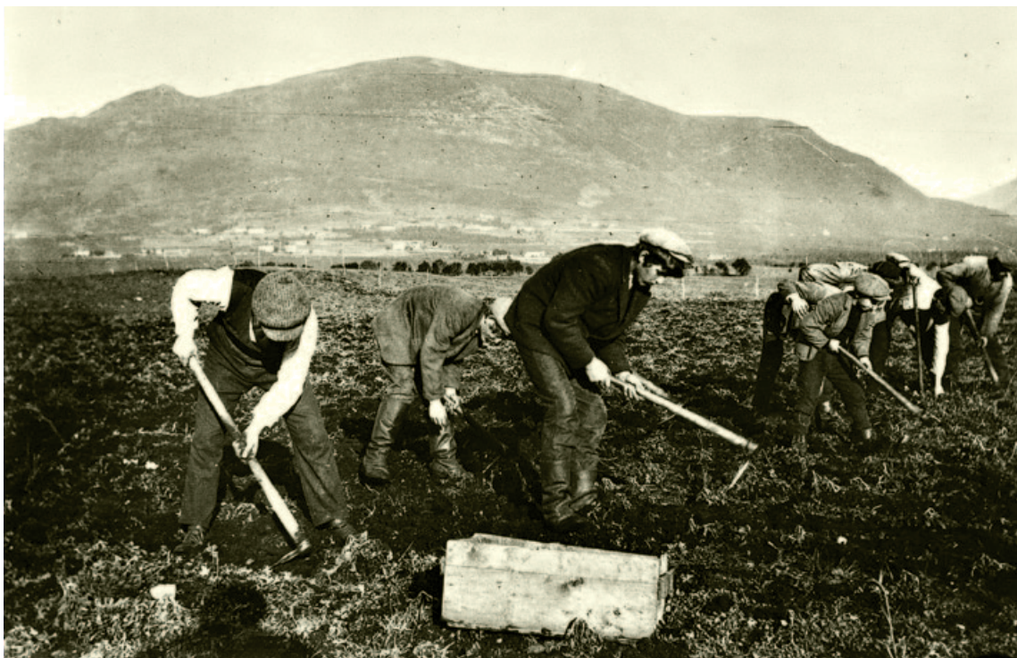
Potetopptaking på Svanviken arbeidskoloni, 1915.