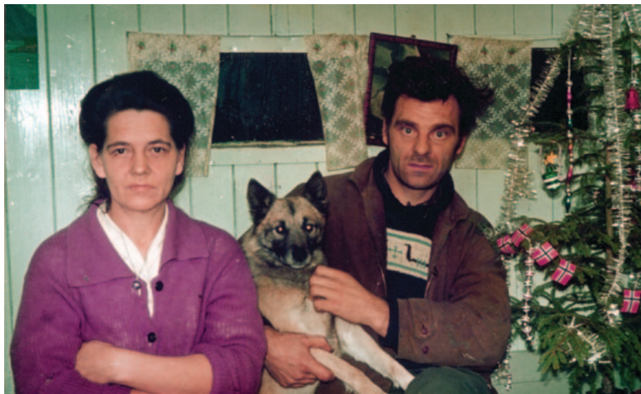
Julefeiring om bord i båten omkring 1950.