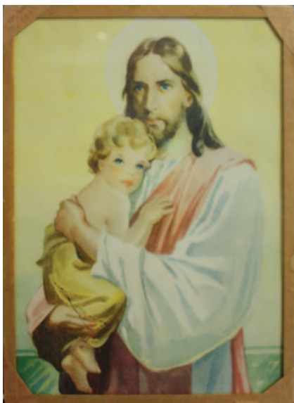
Å lage skjertingsbilder var et vanlig kvinnearbeid etter andre verdenskrig. Motivene varierte, men innrammingen, laget av teip, var den samme.