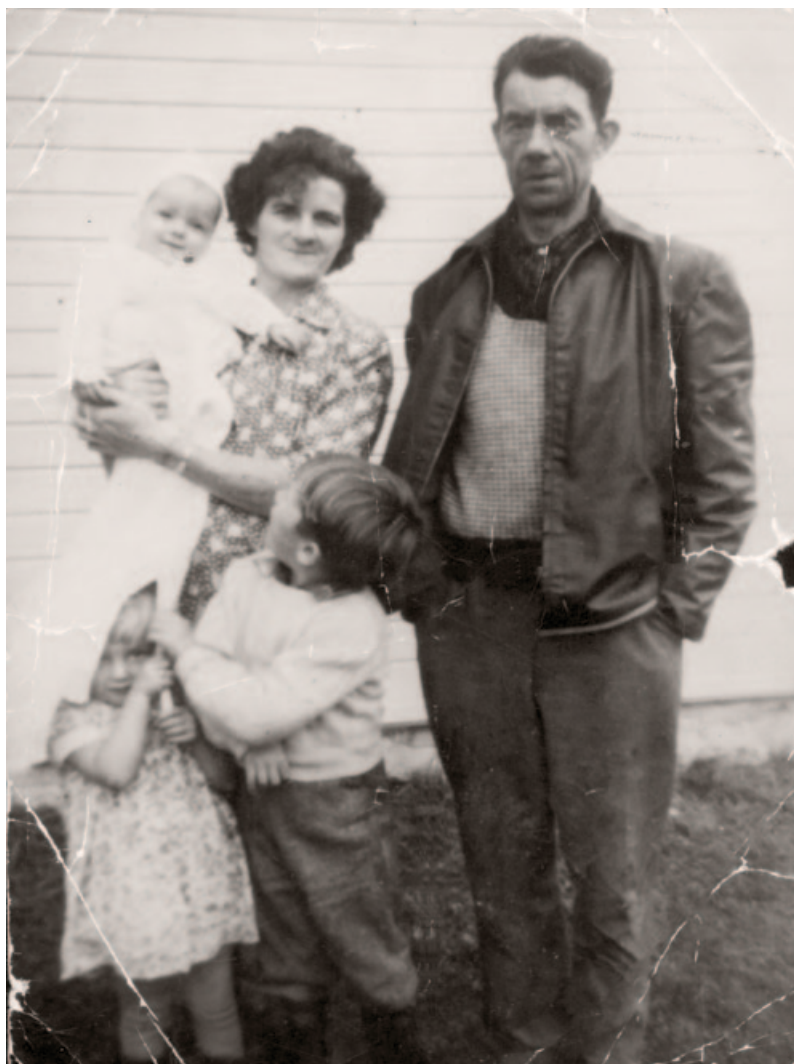
Barn ble født, døpt og vokste opp på Svanviken arbeidskoloni. Familie på 1950-tallet.

Fram til 1929 startet den i alt seks barnehjem. Et av dem var Jacob Walnums barnehjem i Kopervik som åpnet i 1921. Norsk misjon blant hjemløse fjernet til sammen rundt 1500 barn fra foreldrene. Mellom en tredjedel og en fjerdedel av alle romanibarn født mellom 1900 og 1960, som Misjonen kjente til, ble satt bort.