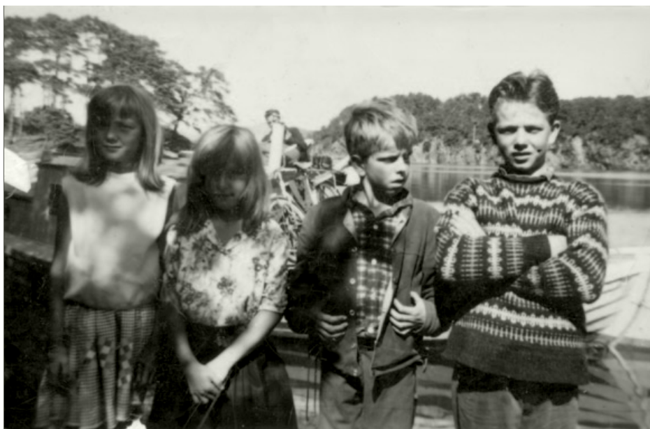
Mange barn vokste opp i båt. Foto tatt omkring 1950.